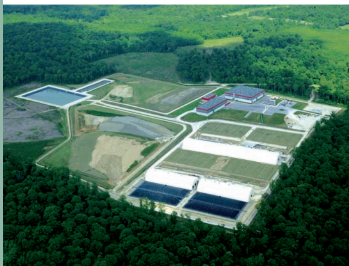
Centre de Morvilliers

En l'absence de seuil de libération pour les déchets issus des installations nucléaires de base seule importe l'origine du déchet au sein de l'installation. Pour accueillir les déchets les moins radioactifs, qualifiés de "très faible activité" (TFA) ; l'Andra exploite depuis août 2003 un Centre dédié, sur la commune de Morvilliers. Il dispose d'une capacité d'accueil de 650 000 m 3 et bénéficie de la proximité du Centre FMA. Au 31 décembre 2004, 16 644 m 3 de colis étaient stockés sur le centre TFA.