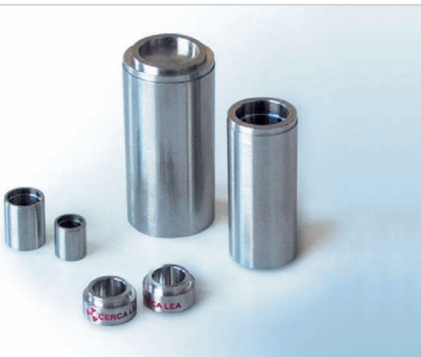
Exemple de sources scellées

Une fois la durée d'utilisation autorisée atteinte (10 ans), les sources scellées doivent être rendues à leur fournisseur, qui les retourne au fabricant ou les font éliminer dans des installations autorisées. Il s'ensuit concrètement trois possibilités :