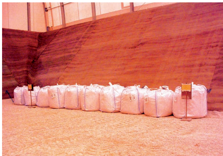
Déchets de très faible activité

L’aspect valorisable de certaines matières radioactives mises en jeu dans le cycle du combustible nucléaire fait cependant débat. En effet, pour partie de ces matières, leur utilisation envisagée à ce jour implique le développement de nouveaux types de réacteurs.