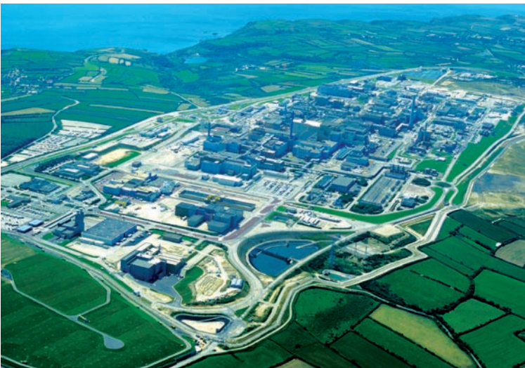
Site de La Hague

niium de retraitement” conserve encore un enrichissement en uranium 235 comparable à celui de l’uranium naturel, mais contient certaines impuretés, présentes en faibles quantités, issues du processus industriel de séparation. Une partie de l’uranium de retraitement séparé dans les usines de retraitement de l’usine Areva-La-Hague est reconverti en UF6 pour être réenrichi en isotope 235 à l’étranger, car l’usine actuelle d’enrichissement ne peut accueillir ce type d’UF6. La quantité d’uranium ainsi reconvertie correspond environ au tiers de l’uranium de retraitement séparé à la Hague annuellement par Areva pour EDF. L’uranium de retraitement ainsi enrichi est réutilisé pour fabriquer du combustible nucléaire.