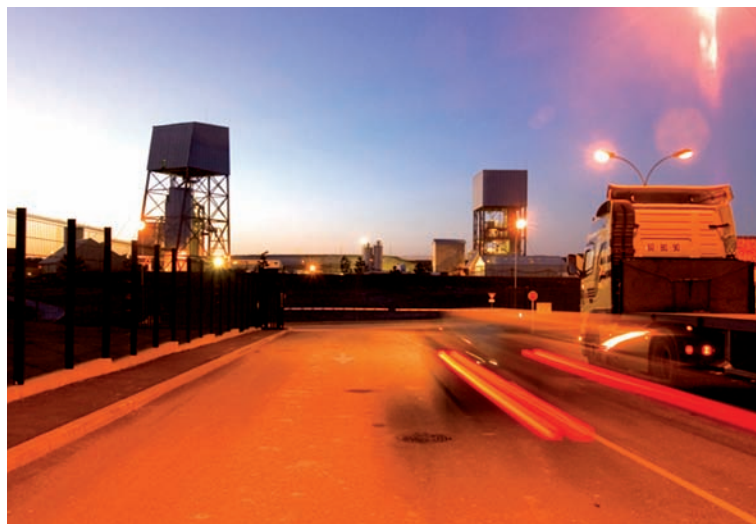
Laboratoire souterrain de Bure

Les recherches sur le stockage géologique profond : le programme des travaux à mener dans l'optique de l'élaboration d'un dossier de demande d'autorisation de création (DAC) d'un stockage s'appuie sur les résultats acquis depuis 1994, date à laquelle ont débuté les recherches dans ce domaine. Il s'agit maintenant de mettre en œuvre les programmes de recherche et d'ingénierie dont les résultats sous-tendront en particulier les documents qui serviront de base au débat public, prévu en 2013. De plus, ces documents prépareront le rendez-vous parlementaire devant statuer sur les conditions de la réversibilité du