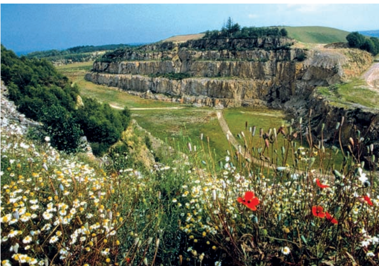
Stockage de résidus de traitement de minerais d'uranium de Bellezane, après réaménagement

Avec la fermeture progressive des exploitations minières, le réaménagement de ces sites a consisté en la mise en place d'une couverture solide sur les résidus pour assurer une barrière de protection géomécanique et radiologique permettant de limiter les risques d'intrusion, d'érosion, de dispersion des produits stockés et ainsi que ceux liés à l'exposition externe et interne (radon) des populations alentours. Les résultats des mesures réalisées sur les stockages sont du même ordre de grandeur que ceux des mesures dans l'environnement du site.