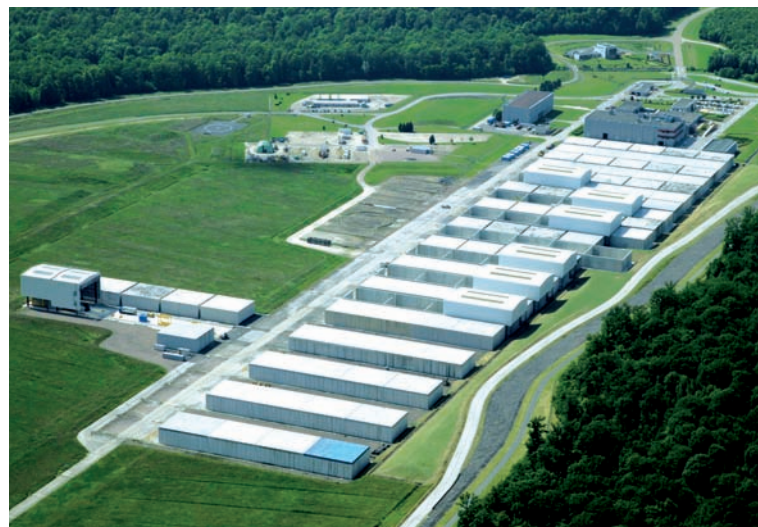
Centre de stockage FMA de l'Aube

Deux centres de stockage de ces déchets existent. Le premier, le centre de stockage de la Manche est désormais en phase de surveillance (depuis